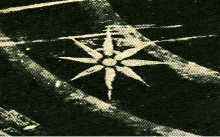
İlahə ananın səmavi işarəsi

Dilçilik İnstitutunun əsərləri. 2012, № 2, s. 32-31.