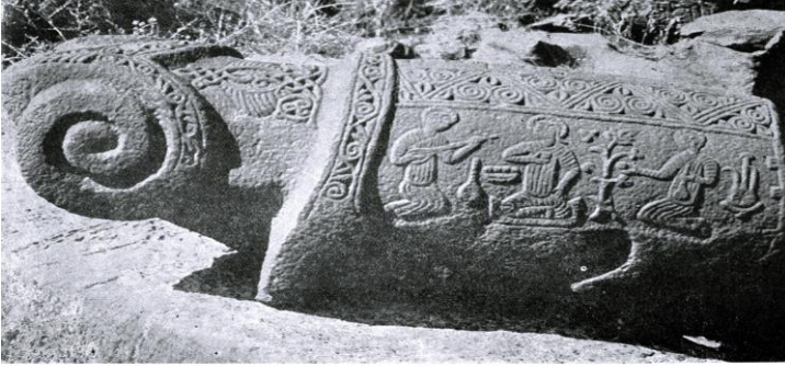
Xristianlıqdan öncəki bu abidə əski Culfadan tapılıb Gürcüstana aparılmışdır

Eyni zamanda sübuta yetirək ki, Şota Rustaveli Aran nəslindən çıxmış, onun davamçısı Çolakaşvili mənşəcə türk olmuşdur. Yaqub Çortaveli türkmənlərin Çor, İakov Saruqski Sarı nəslindən çıxmışdır.