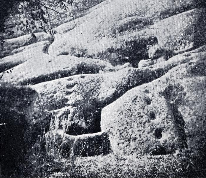
Qarayazı mağara-monastrlarının oyma su çuxurları

min illik bir dövr ərzində dəfələrlə dəyişilmiş, qədim Siren kultu öz ilkin məzmununu itirmişdir. Yalnız dəyişməyən bir şey var. O da Siren sözünün sevgi anlamıdır. Çuvaşlar xristian dinini qəbul edənə qədər hər ilin yaz fəslində keçirdikləri sevgi ayinini Siren adlandırırdılar (Родионов 1983. 21-24).