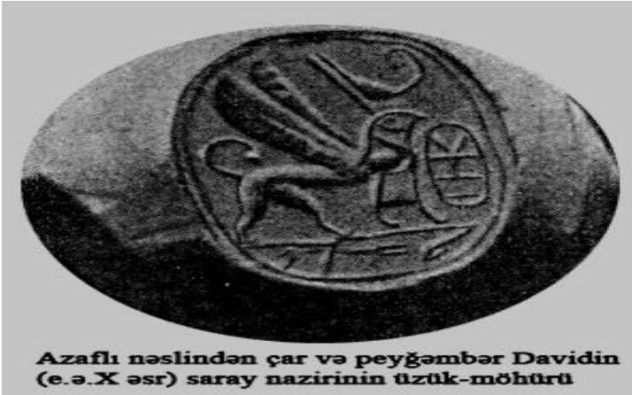
Azaflı nəslindən çar və peyğəmbər Davidin (e.ə.X əsr) saray nazirinin üzük-möhürü Yüsusəlim sarayının kansleri İoxim ben-Asafın (e. ö. 701-ci il) möhürü